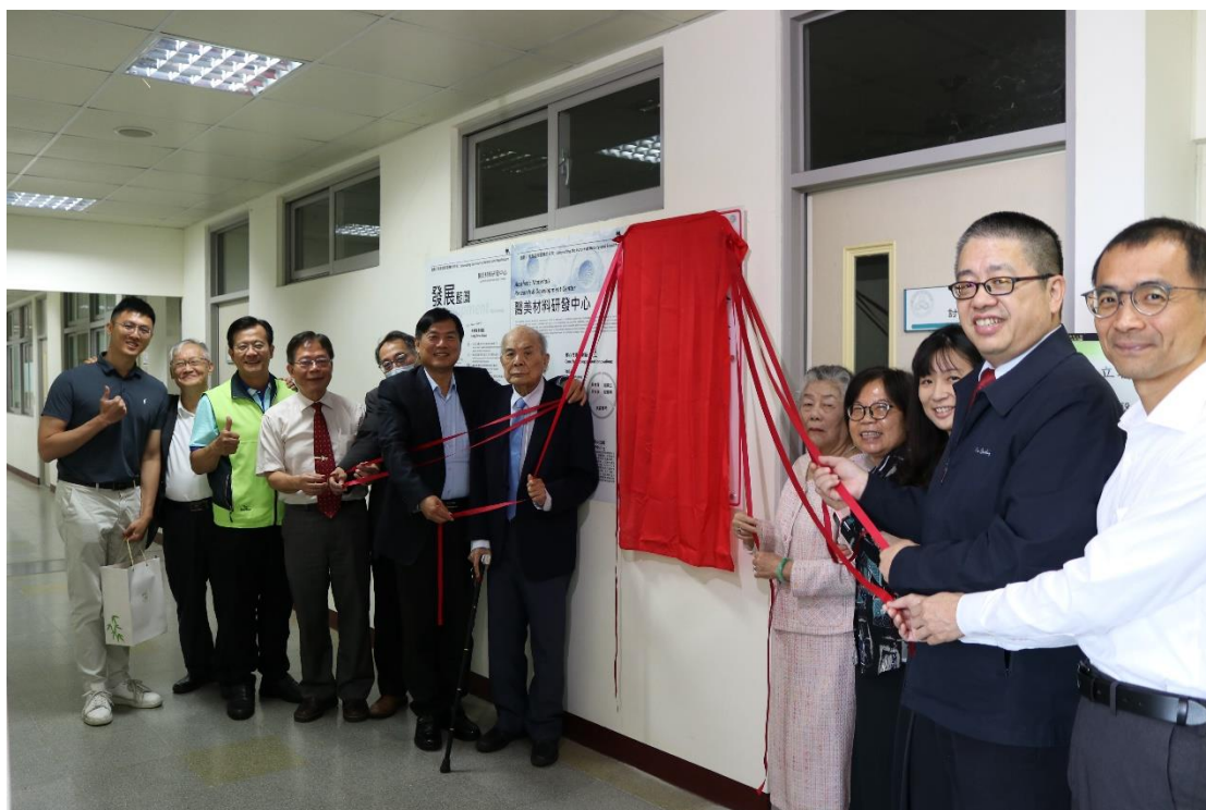
圖 4-1. 「醫美材料研發中心」揭牌儀式