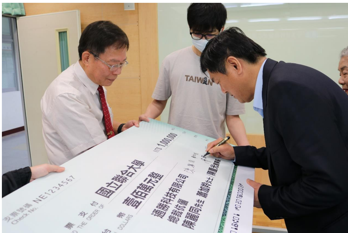
圖 2-3. 「醫美材料研發中心」簽名儀式