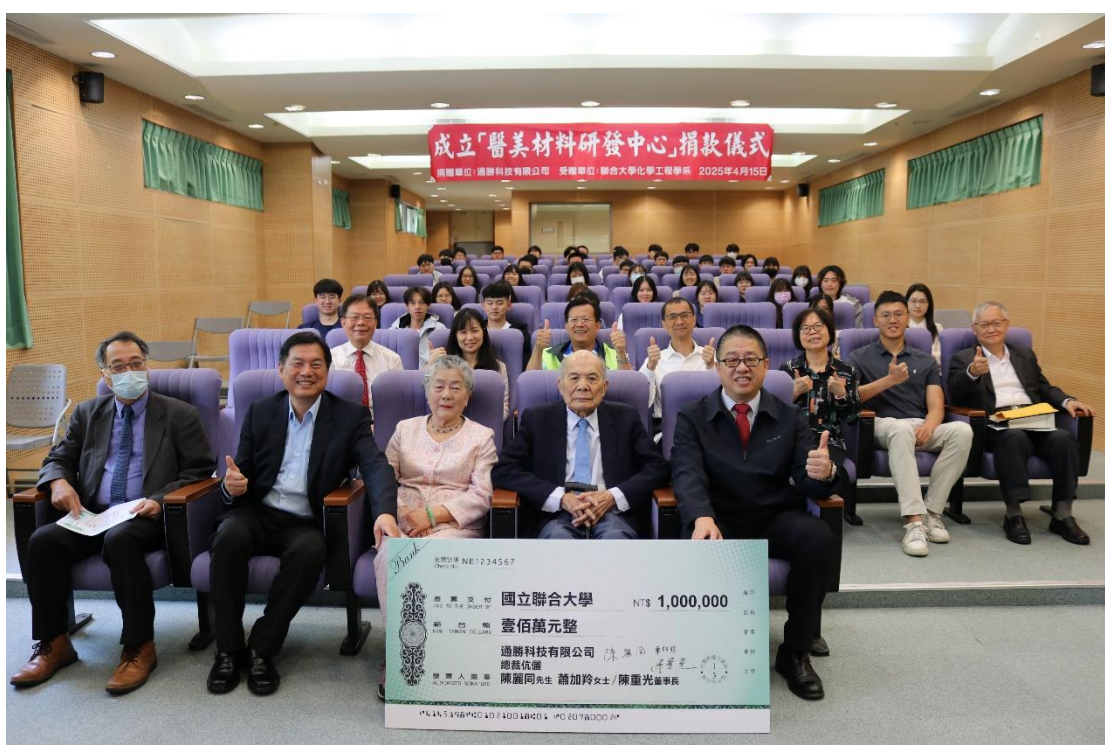
圖 1-2. 「醫美材料研發中心」捐款儀式