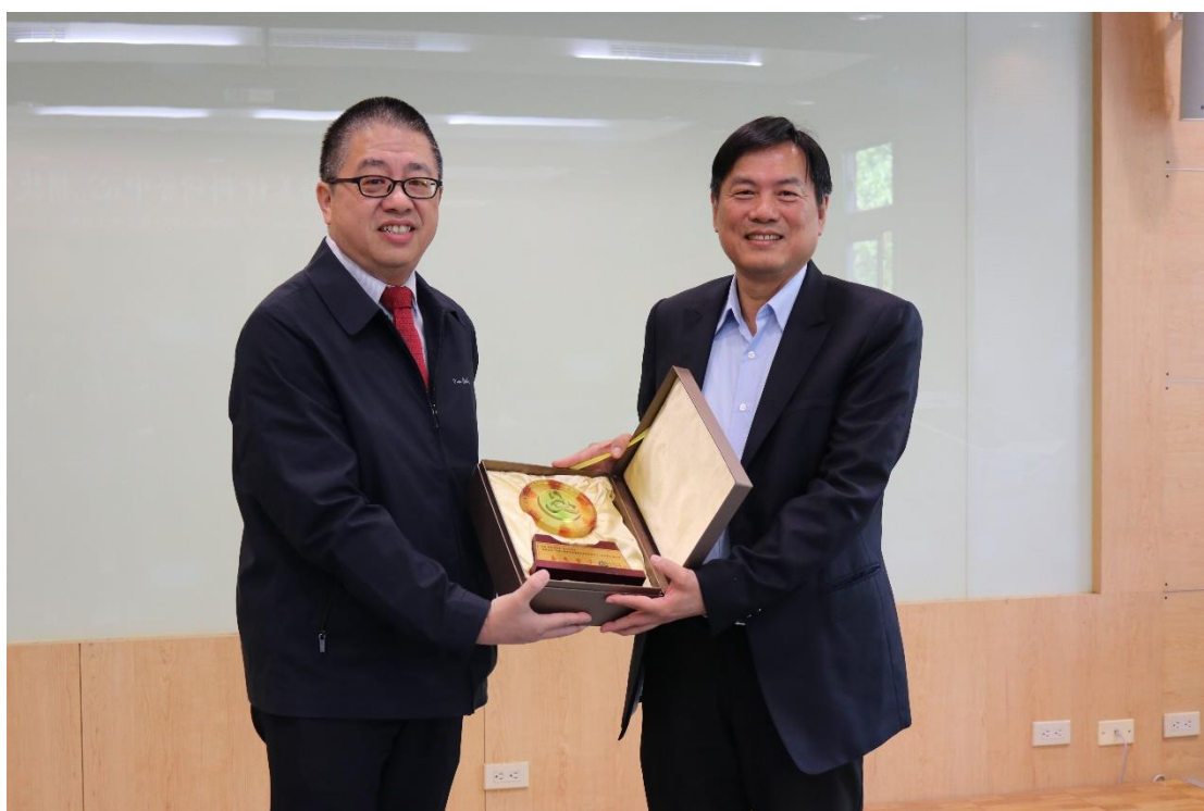
圖 3-1. 致贈感謝紀念品