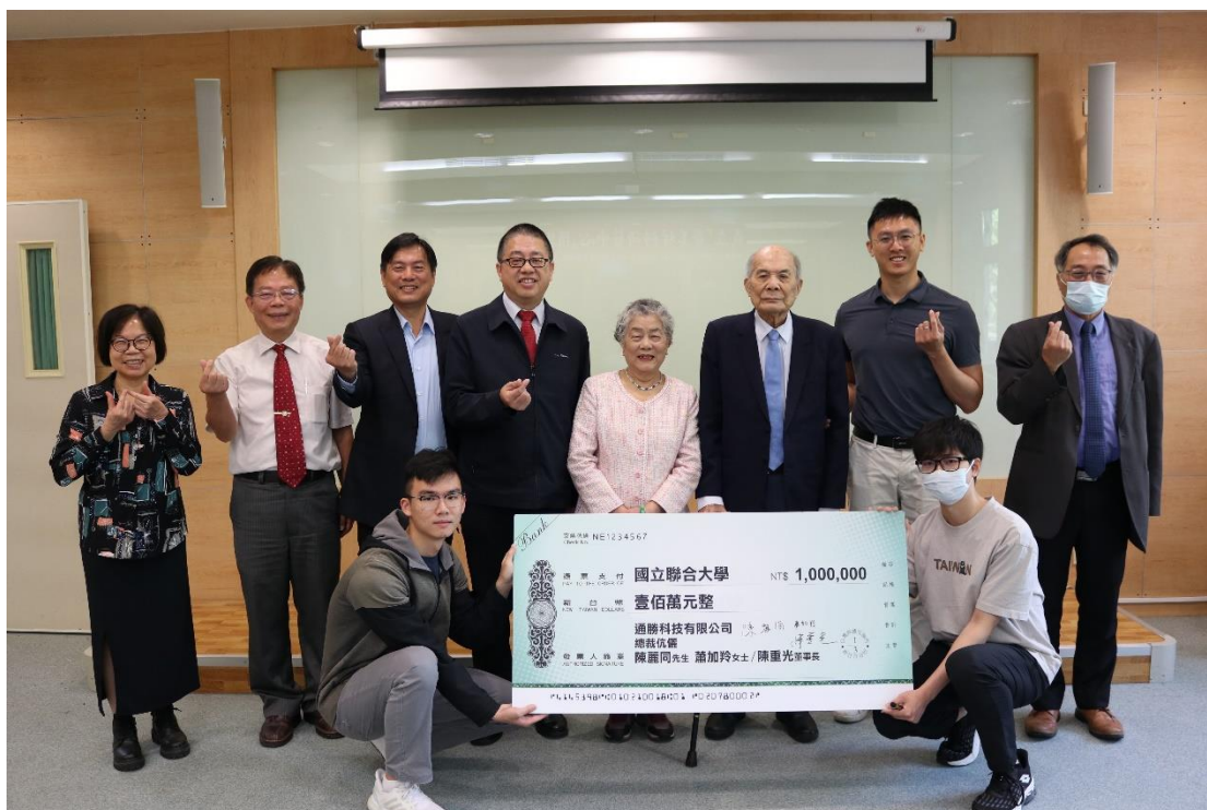
圖 1-1. 「醫美材料研發中心」捐款儀式