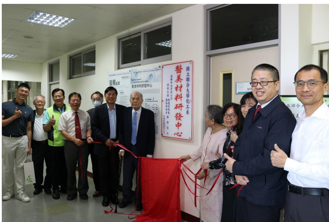
圖 4-2. 「醫美材料研發中心」揭牌儀式