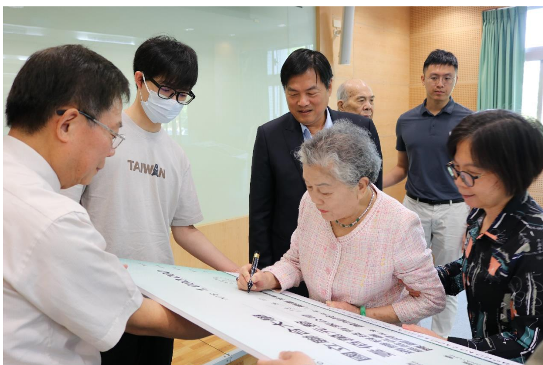
圖 2-2. 「醫美材料研發中心」簽名儀式